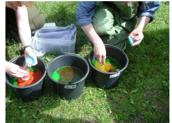
Freilandversuche sind aufwändig und nicht immer unbedenklich.